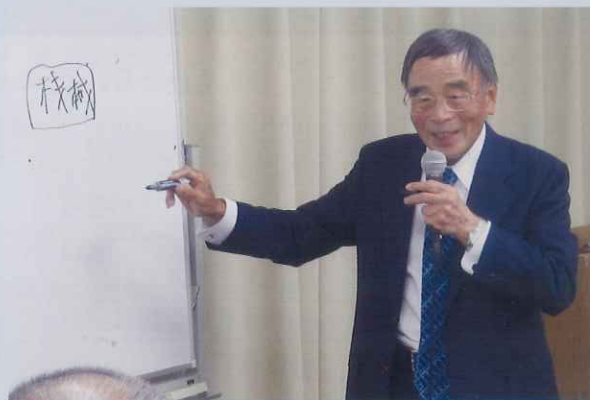
▲理化工業株式会社 保知会長