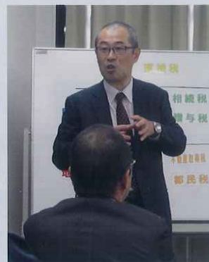
▲講師の峰青年部会租税教育委員長